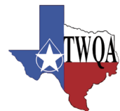
得克萨斯州水质协会会员

沃茨亚太、中东及非洲总部 上海市延安西路500号26层 沃茨（上海）管理有限公司 邮编：200050 电话：+86 (21) 2223 2999 传真：+86 (21) 2223 2900 热线电话：400 070 8760