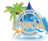
佛罗里达水质协会会员